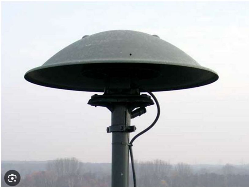
Alte Sirenen Typ E57 Fa. Hörmann

Ursprünglich 4 im Ort, 1 noch in Betrieb (Grundschule)