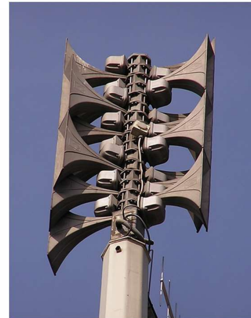
Neue Sirenen Sonus Fa. Helin

Ursprünglich 4 im Ort, 1 noch in Betrieb (Grundschule)